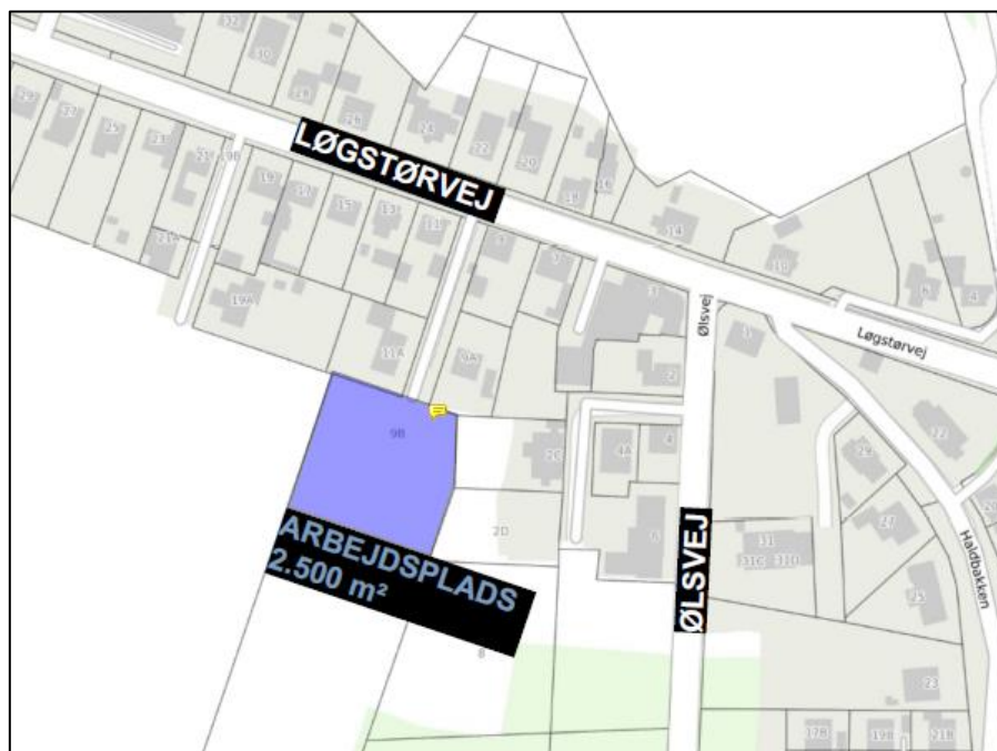
Figur 1. Ønsket placering af midlertidigt oplag på matr. nr. 171a Hobro Markjorder.

Placering af det midlertidige oplag fremgår af nedenstående kort.