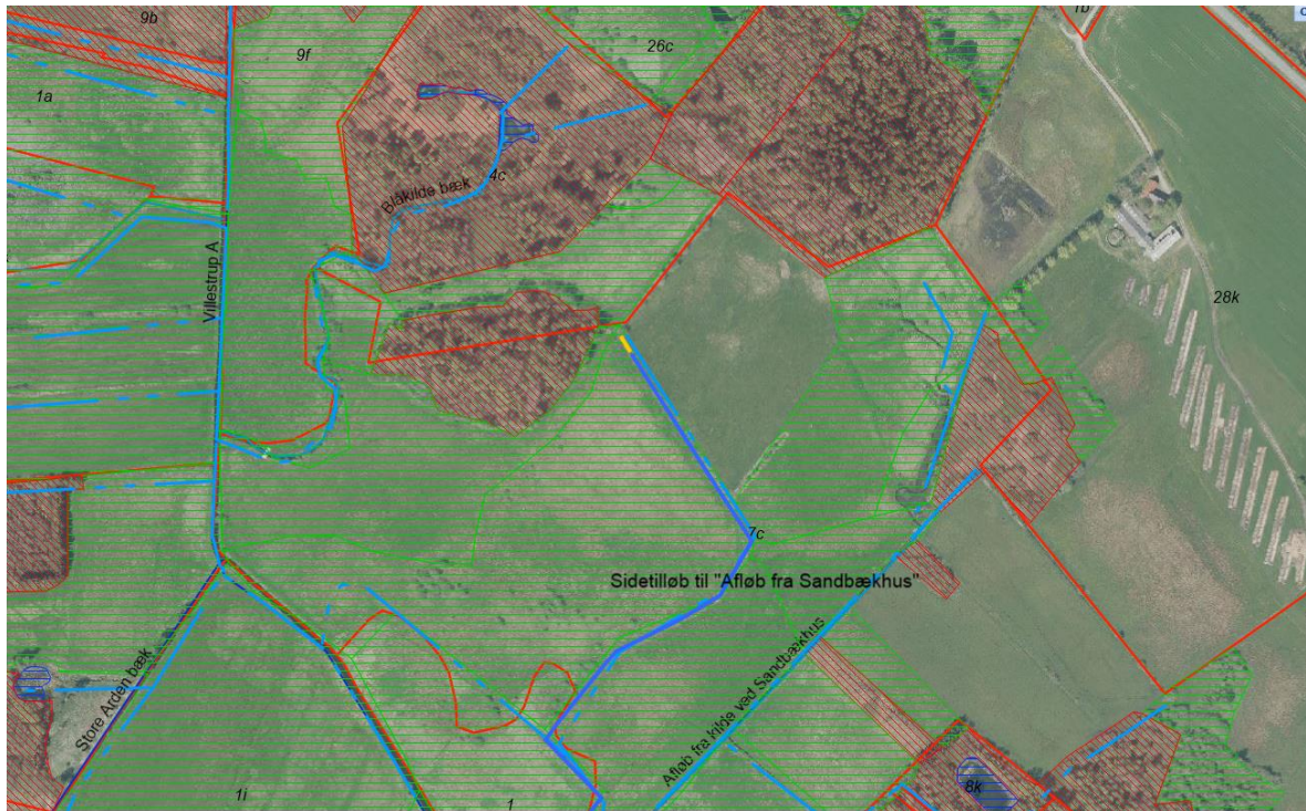
Bilag 1. Arealer og vandløb beskyttet efter naturbeskyttelseslovens §3.