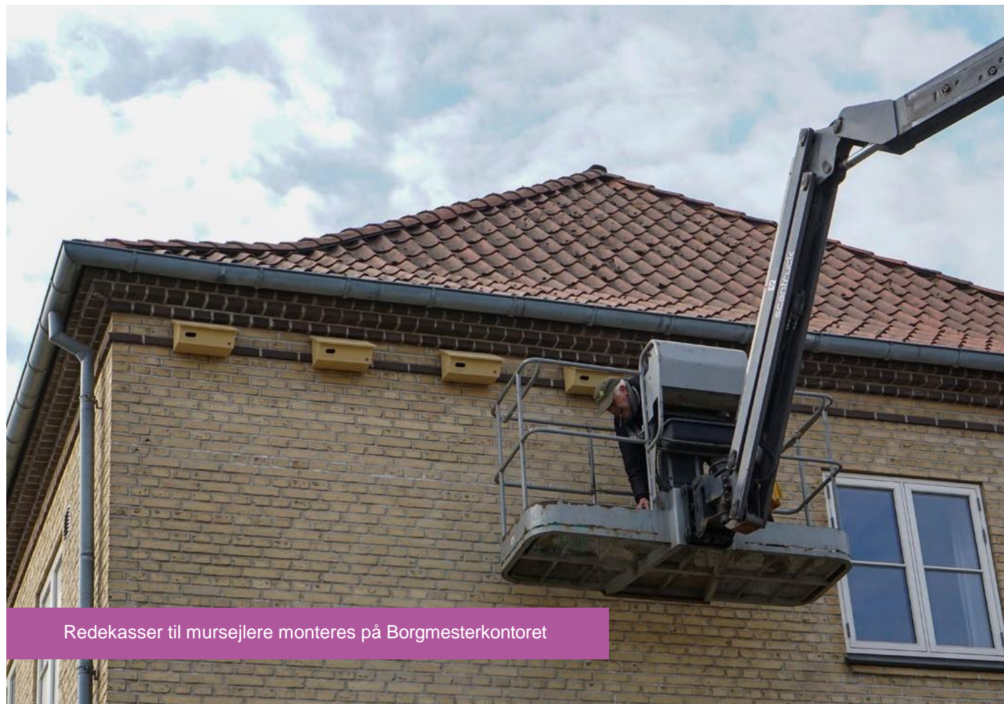
Redekasser til mursejlere monteres på Borgmesterkontoret