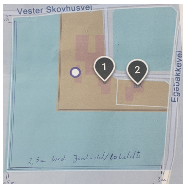
Situationsplan med jordvoldens placering

Der er søgt om tilladelse til etablering af en jordvold ca. 0,5 meter fra det sydlige og vestlige skel på Egebakkevej 8, 9510 Arden.