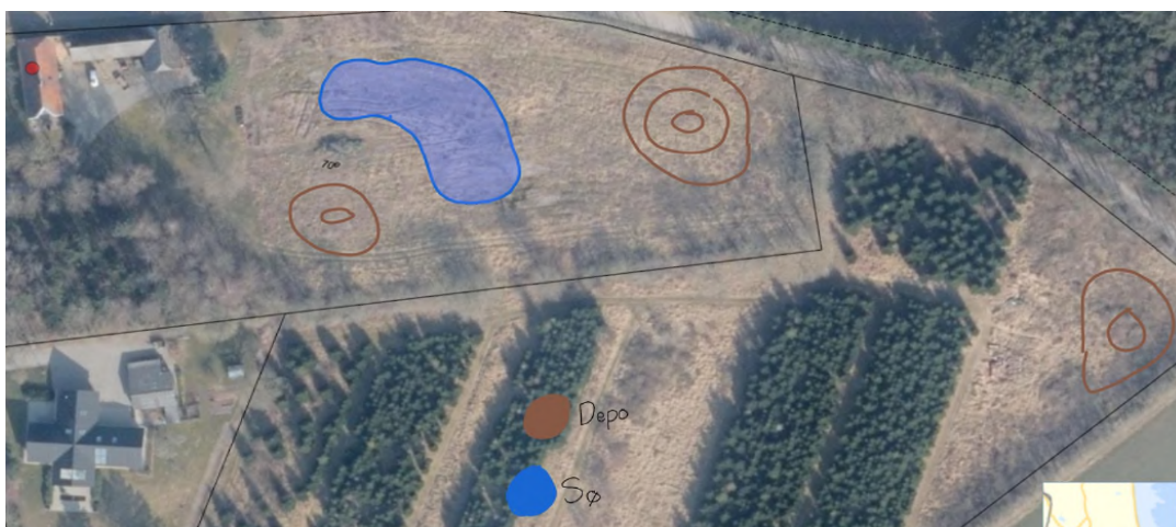
Oversigtskort med søen og jorddepoternes placering

Søen er på ca.1500 m 2 med en dybde på mellem 0,5 til 2 meter. Placering kan ses på nedenstående oversigtskort.