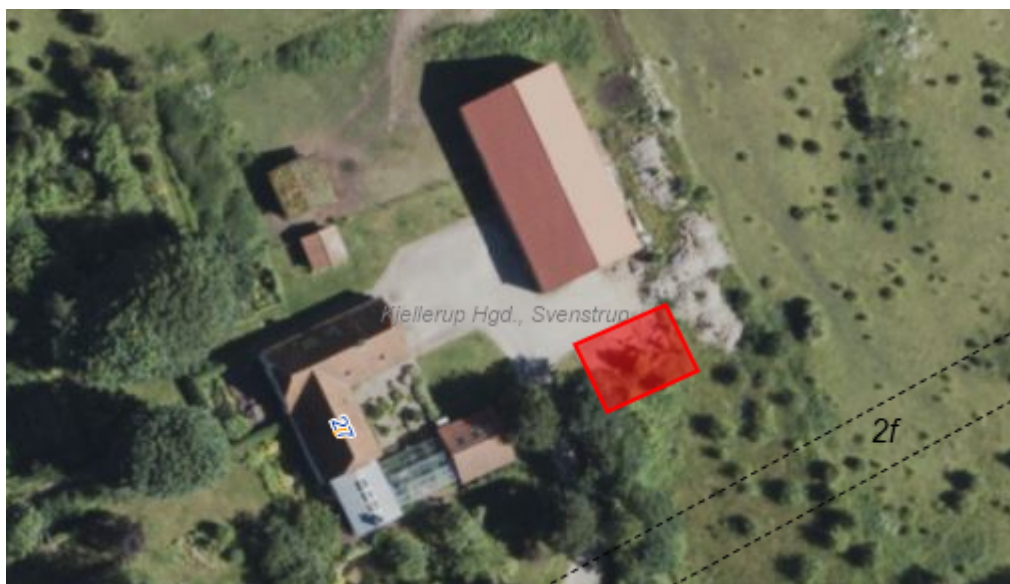
Figur 1: Luftfoto med bygningens placering er markeret med rødt

Bygningen nedgraves delvist i terræn og beklædes med grønt tag.