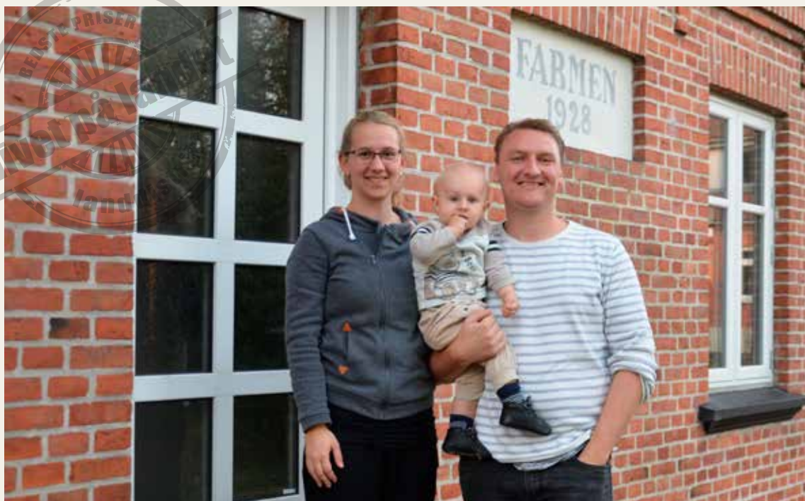
Familien er vendt tilbage til Veddum, hvor de har købt hus på Veddum Hovedgade.